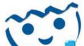
table n° 9

3 ème open d'échecs de Domloup tournoi petits pions