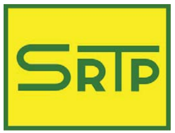
table n° 43

3 ème open d'échecs de Domloup tournoi principal