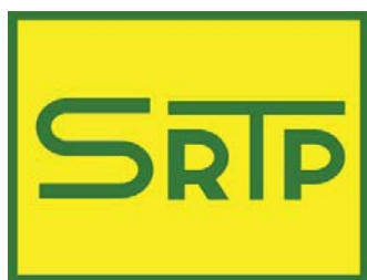
table n° 19

3 ème open d'échecs de Domloup tournoi principal